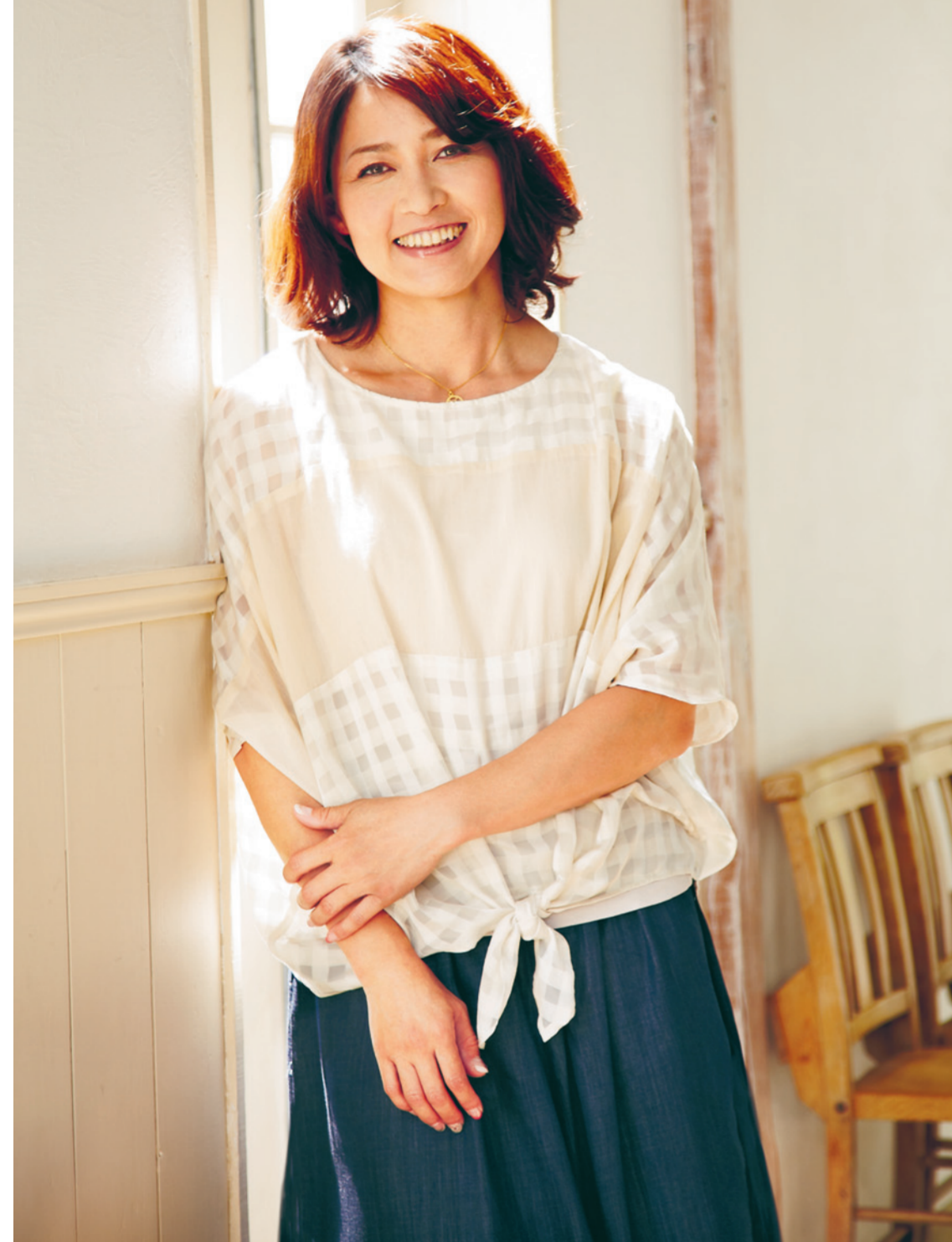
文:道分日出子/ヘアメイク:加藤 圭(竹邑事務所)